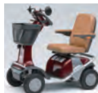
スズキタウンカート